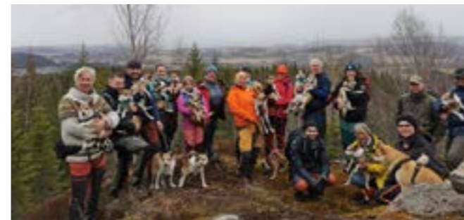
En flott gjeng deltok på treff og tur på Munkeby

Avdelingen arrangerte kurs i Rallylydighet hos Sportshunder helgen 15-16.april. Det var 8 lærevillige og flotte hunder som deltok på et flott kurs. Vi var på Havstein, og vi var både inne på låven og ute på treningsområde. Like fasinerende hver gang å se hvor mye hundene tar med seg fra en kursdag til neste.