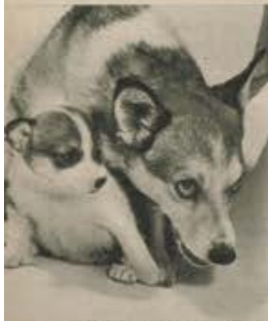
— Fotografer er farlige. Hold deg under mamma's beskyttende hånd!