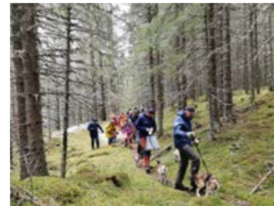
Varriert terrenge

Det var 17 tobeinte og 18 firbeinte som hivde seg med på en flott tur, til tross for lett snødryss og kjølig temperatur. Vi hadde med oss kaffe og div bakst fra Munkeby herberge som avdelingen sto for, og som vi koste oss med på rasteplassen. Etter turen var vi flere som nød godt av dagens middag på herberget. Moro å se så mange flotte hunder, samt både nye og gamle hundeeiere.