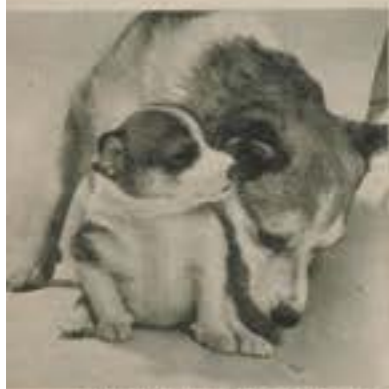
— Du kan trygt si det til mamma!

Nå fins det knapt 20 eksemplarer igjen av Lundehunden fra Lofoten. På røntgenbildet (helt t. v.) ser De «hånden» til en lundehund. Ved siden av en vanlig hundepote. Tell fingrene! Lundehunden står i overhengende fare for å dø totalt ut.