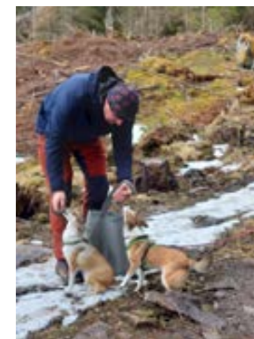
Liten rast underveis

På vegne av styret for NLK, avd Trøndelag Hilde Birgitte Berg Alto