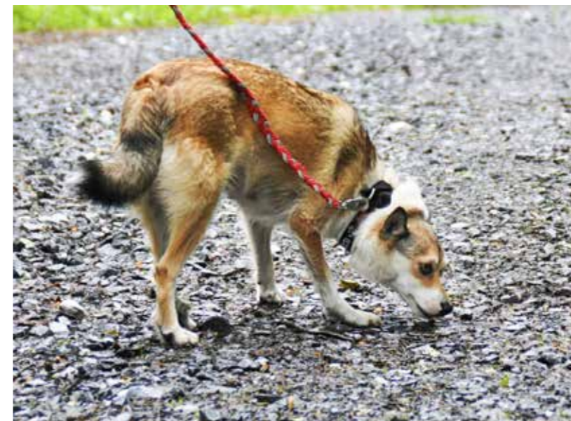
Fra Kvam lundehundløype

Info om arrangementer etc vil komme på epost og i våre kanaler på facebook.