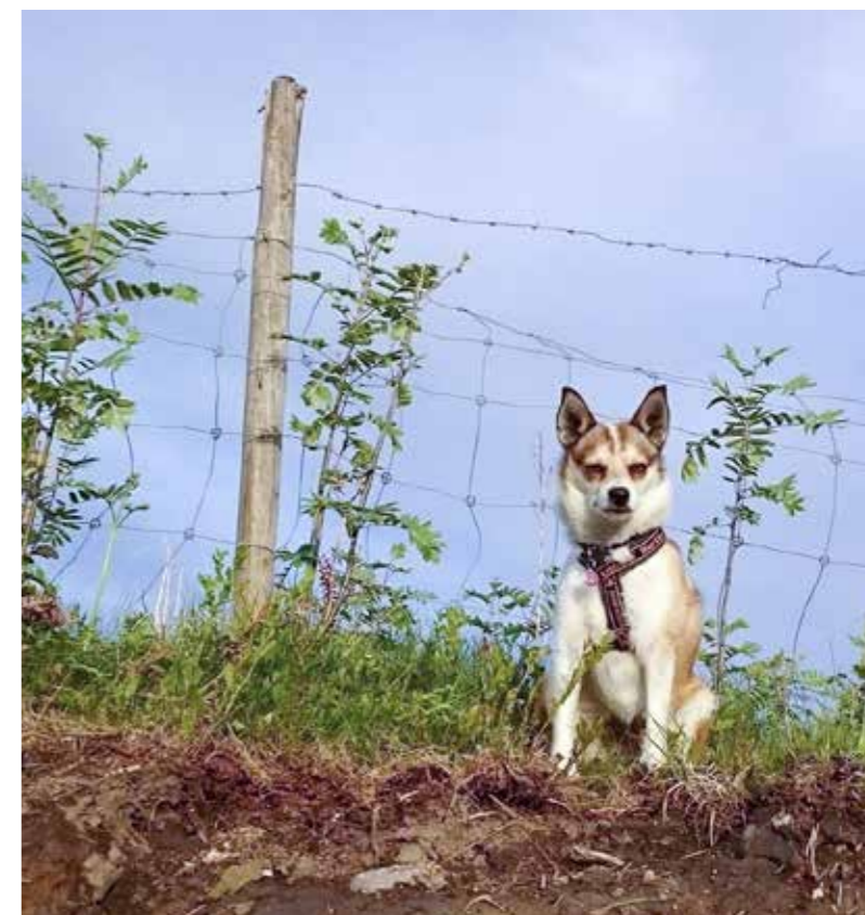
Holli, min første lundehund