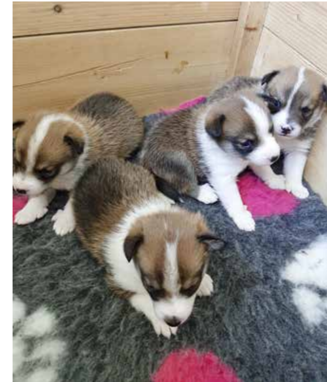
G-kullet fra Kennel Vollakloa

Tekst av Sigrun Rytter