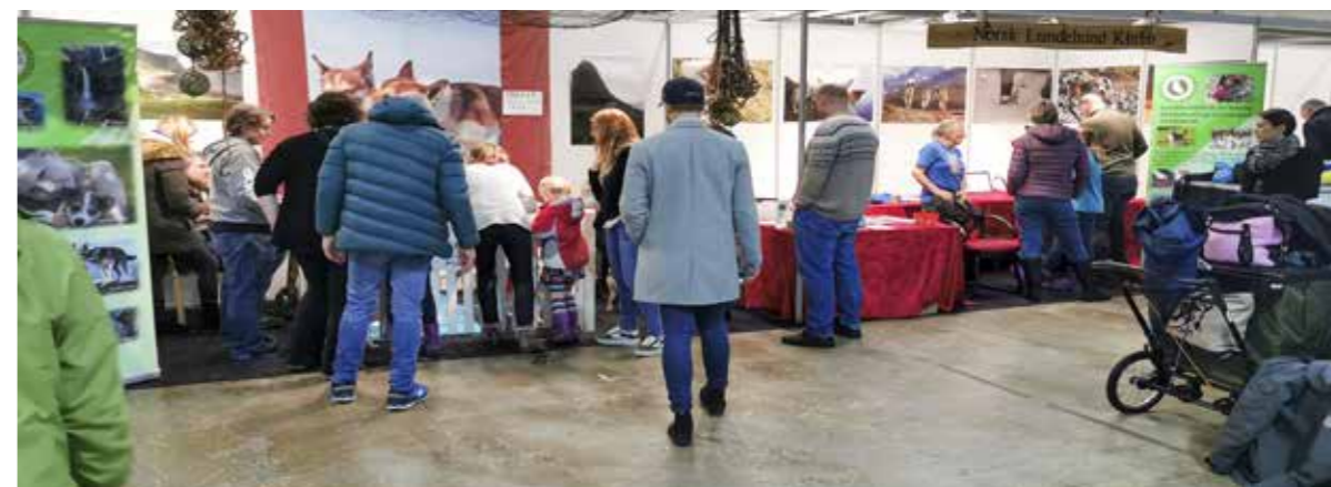
Lundehundstand på Dogs4All

Under festmiddagen ved årets lundehund-dager på Morokulien, fikk jeg æren av å bli tildelt klubbens hederspris for 2021. En av kriteriene for at jeg fikk denne var jobben jeg har gjort med ansvaret for lundehundstanden vår.