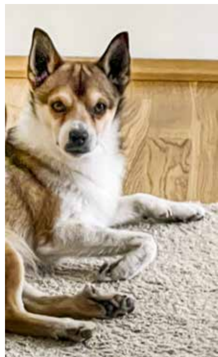
Lyrpya's Sankt Halvar Fenris