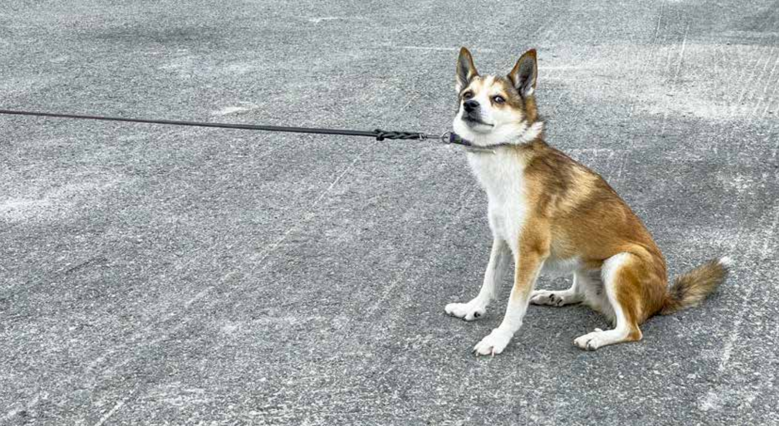
Værøy-Daga Av Vollakloa har satt på lundebremsen

Returadresse: NLK v/Jon Wagtskjold Lyshovden 128, 5148 Fyllingsdalen