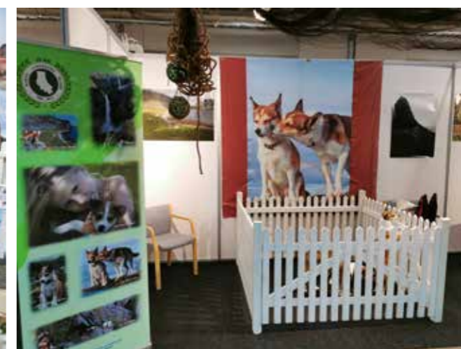
Alltid innhegning med lundehund