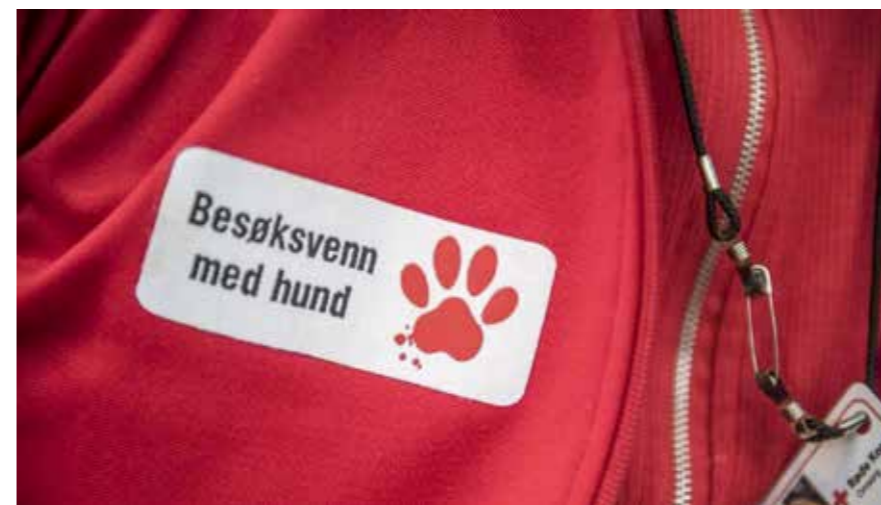
ID-kort for besøkshundeier

Det er besøket og hunden som er hovedsaklig i fokus. Noen personer