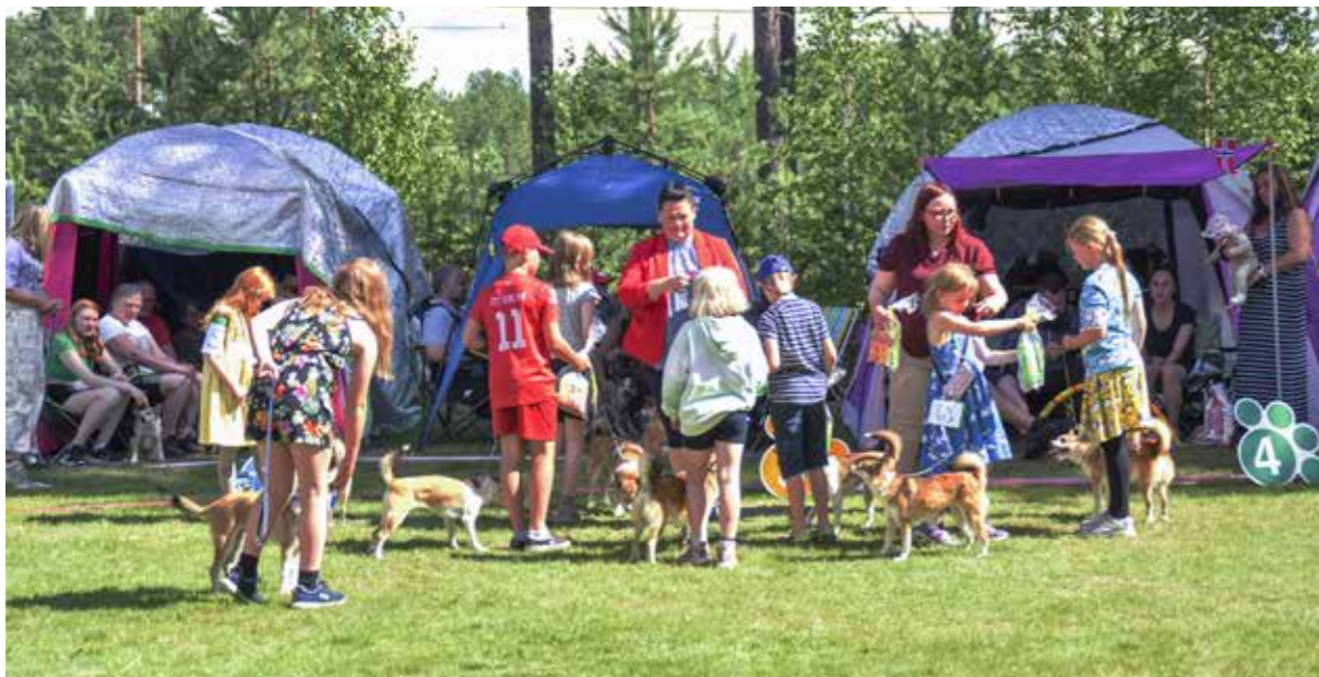
Barn og hund