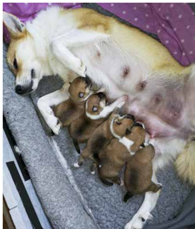
Hekla med valper i 2018

Jeg har bare hatt tre kull med levende valper, og jeg tror nok at sist ankomne Alma blir en sånn spesiell valp.