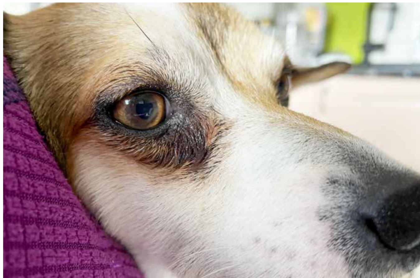
Rennende øyne hos lundehund er normalt. Økt renning i vår/sommerhalvåret kan tyde på pollenallergi.

I likhet med oss mennesker kan også hunder utvikle mange forskjellige former for allergi. Vi deler de inn i fôrallergi (matallergi), inhalasjonsallergi (miljøbetiget allergi), kontaktallergi og loppebittallergi. Her kan du lese nærmere om de ulike formene for allergi hos hund.