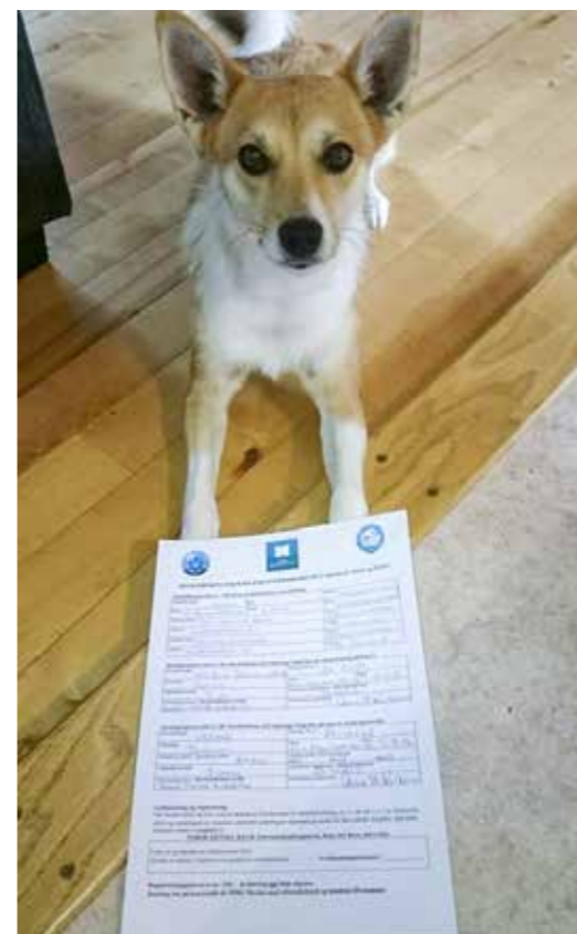
Hekla med bevis godkjent søkshund på vilt