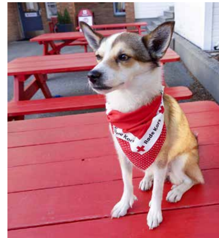
En stolt Diana er nettopp blitt godkjent som besøks-hund, og har fått på seg sin egen Røde Kors-uniform

Anne Brith Terland Sahlsten intervjuet av Hege Charlotte Faber.