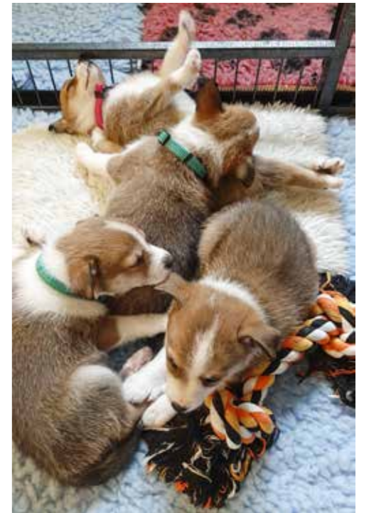
G-kullet fra Vollakloa, foto Dagrunn Mæhlen

Det kommer også jevnt og trutt valpekull her i Trøndelag, noe som er helt fantastisk. Vedlagt bilde er av siste kullet til Dagrunn Mæhlen i Lensvika.