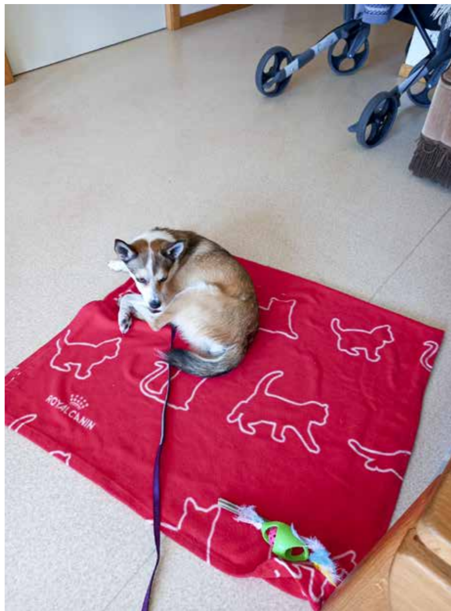
Diana, besøkshund på jobb

Kurset for besøkshund går over to helger med minimum to uker mellom helgene.