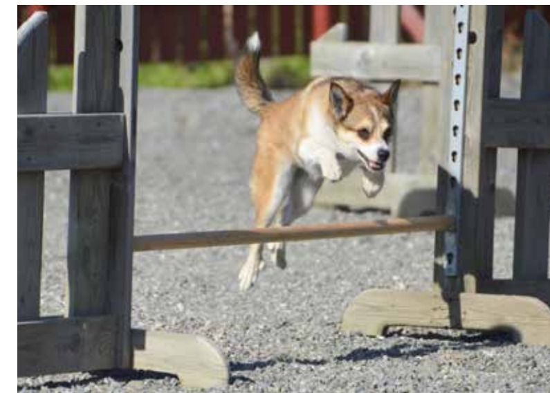
Vingheias Saga

Agilty har vært en populær hundesport der mange lundiser har prøvd seg på dette og også konkurrert, men ser ut til at ikke så mange deltar i agiltykonkurranse i våre dager, og tar det mer som sosial trening og samarbeid med hunden sin.