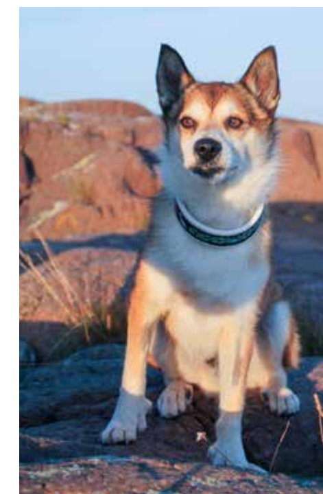
Eriksro Charmiga Balder