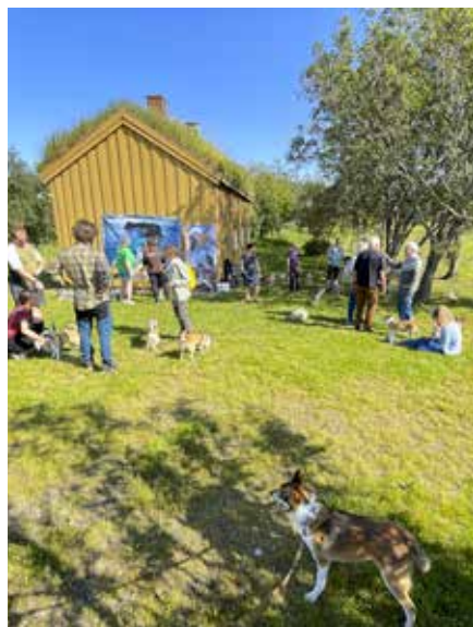
Mange lundehunder, eiere og nysgjerrige dukket opp til lundehundmyldringen