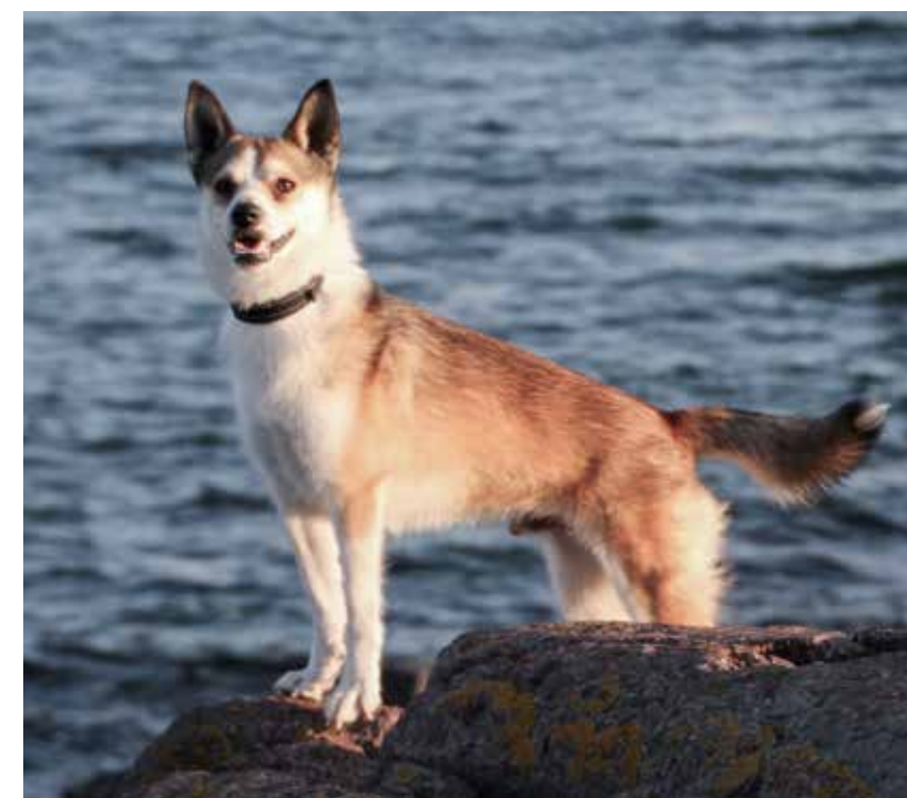
Zippo Forglemmegei av Revehjerte