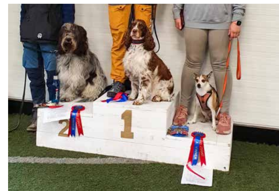
Premieutdeling i klasse 2 med 1 premie og 3 plass med 192 poeng.

Jeg ønsker å si takk for meg og for at dere har lest og fulgt min historie frem til i dag. Ved ønsket om å starte konkurranserettet lydighet så har jeg råd til deg om å kontakte den lokale hundklubben din, meld deg på kurs og sette seg inn i de ulike grenene sine regler. Det er kun trening som skal til og med påståvilje kan dere komme langt! Venter du valp så anbefaler jeg videre å starte tidlig med treningen. Og husk all lydighetstrening er hverdagslydighet!