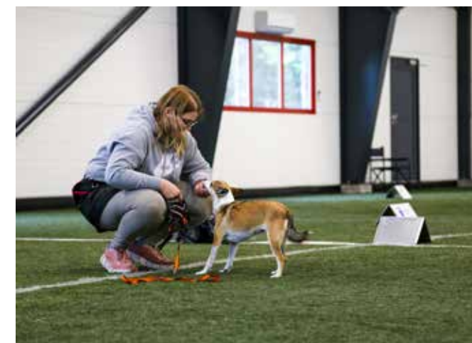
Mye klapp og ros etter et fantastisk løp/prestasjon fra stevnet 4 og 5.09.21.

Utenom lydighet og rally så har vi også jobbet litt med agility. Lundehunden er for meg en allsidig hunderase som kan