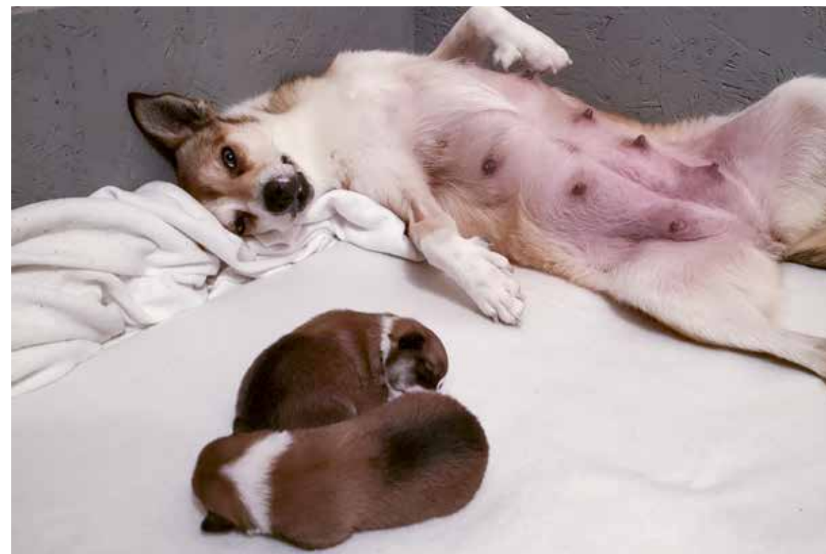
Irja og de små en av de første levedagene.

Løpetid er noe alle tisper vil oppleve. Det er en naturlig del av tispens liv og i motsetning til oss mennesker er hunden fertil hele livet, altså den har ingen menopause.