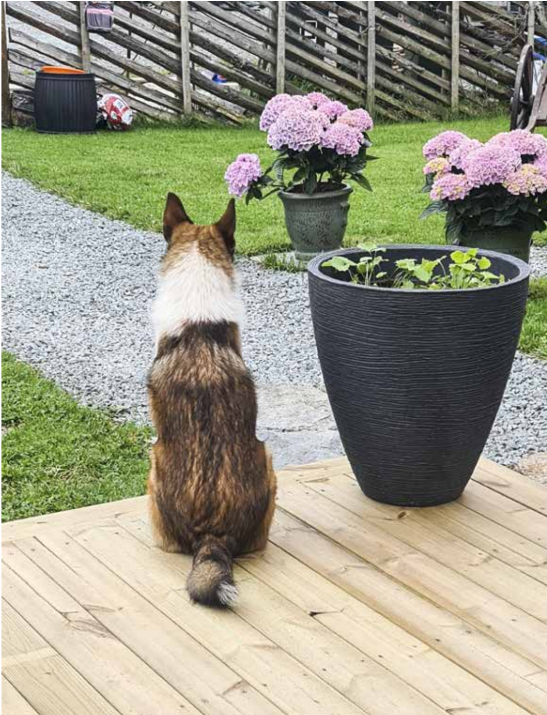
Vilje (Hakon) tar seg en tenkestund.

Returadresse: NLK v/Jon Wagtskjold Lyshovden 128, 5148 Fyllingsdalen