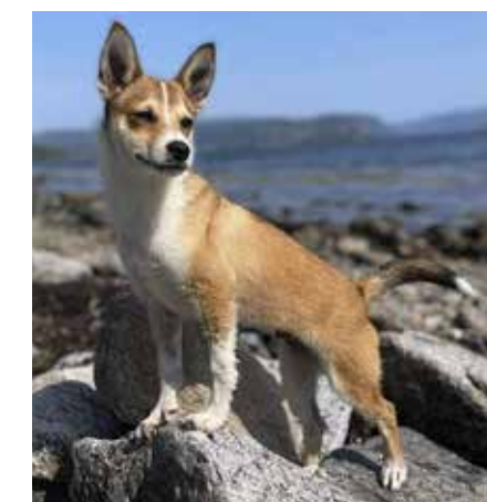
Urdfells Driva Finse etter Zippo Forglemmegei av Revehjerte