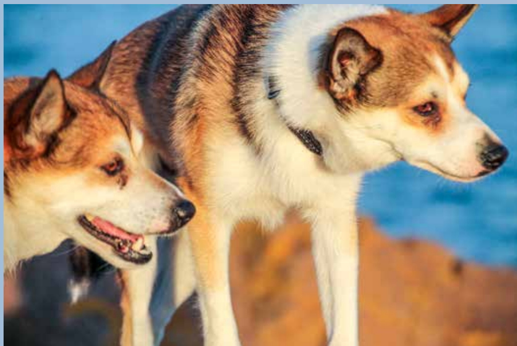
Zippo og Balder