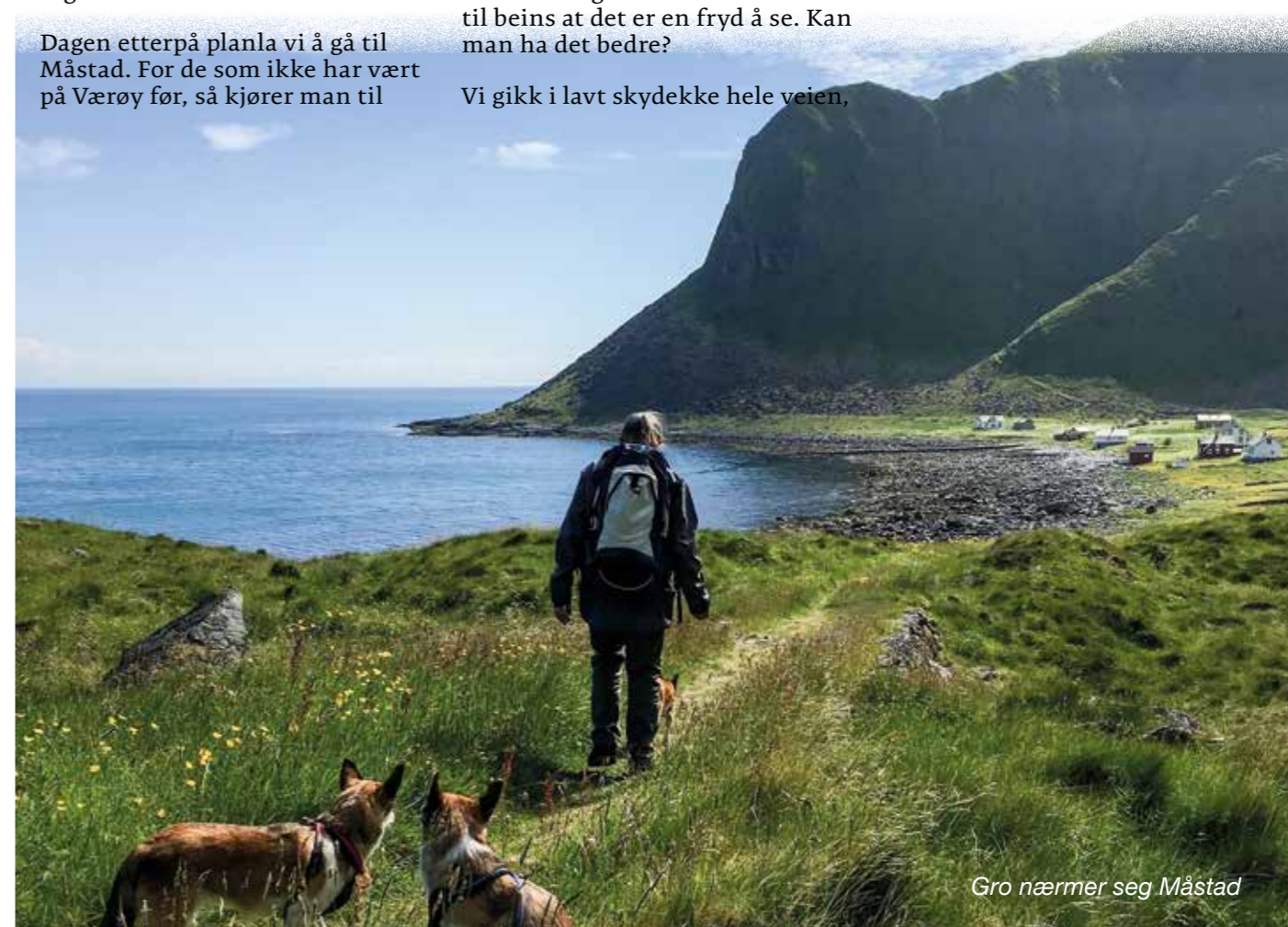
Gro nærmer seg Måstad

Men en ting er sikkert! Jeg kommer igjen. Måstad har en egen plass i hjertet mitt, og sånn er det bare.