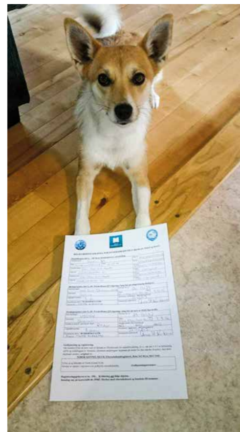
Hekla er ettersøkshund

som «Ettersøk videregående» dersom gjennomført kurs kan dokumenteres overfor offentlig myndighet før ny avtale inngås.