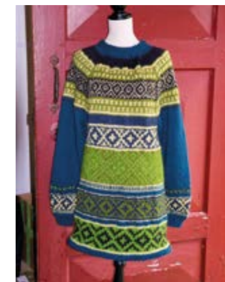
Hjemmestrikket genser i mohair-garn, str dame large