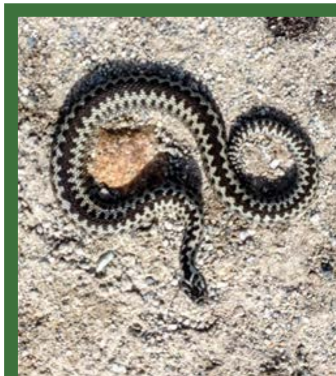
Hoggorm kveilet til hugg.

førstehjelp fram til de kommer til veterinær. Behandlingen består vanligvis av væskebehandling (for å tynne ut giften og «skylle» nyrene) sammen med smertestillende og evt antiserum dersom hunden er veldig påkjent. Noen ganger gis også antibiotika dersom infeksjonsfaren vurderes som stor. Du må derfor få hunden til veterinær så fort som mulig, og helst bære den hele veien dersom den er bitt av hoggorm.