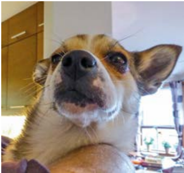
Daga har tygget på en veps.

Sommeren er tiden for uteliv, både for folk og hunder. I Norge har vi få farer å bekymre oss for i naturen, men i blant hender det at uhellet er ute.