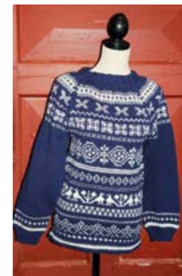
Hjemmestrikket genser i ull, str dame small - medium

Hvert lodd koster 10,- kr. Hvis du vil kjøpe lodd, betal inn ønsket beløp til konto nr 7877 06 94409 Norsk Lundehund Klubb. Merk innbetalingen "Lodd 2016". Send beskjed til leder om hvor mange lodd du har betalt for.