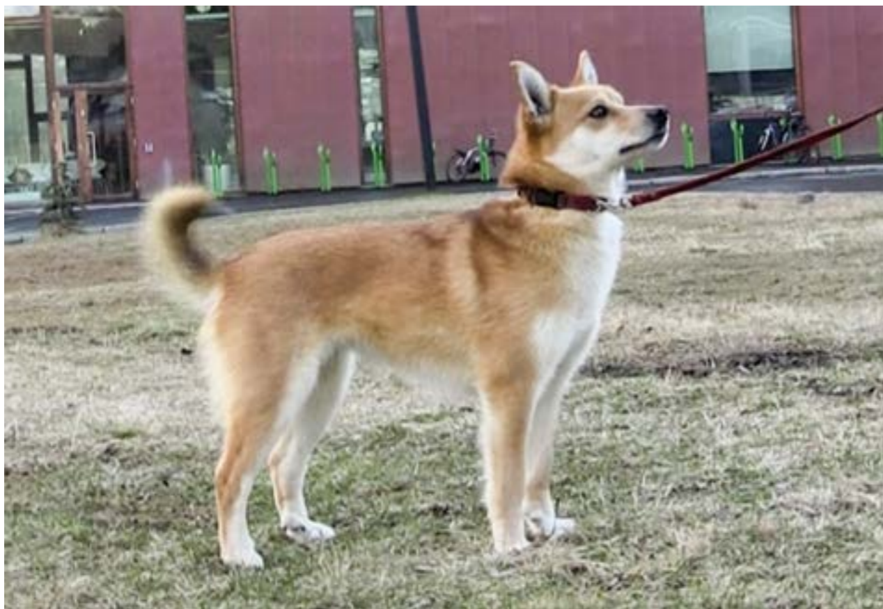
Fra mønstringen av Kunna fra B1-kullet.