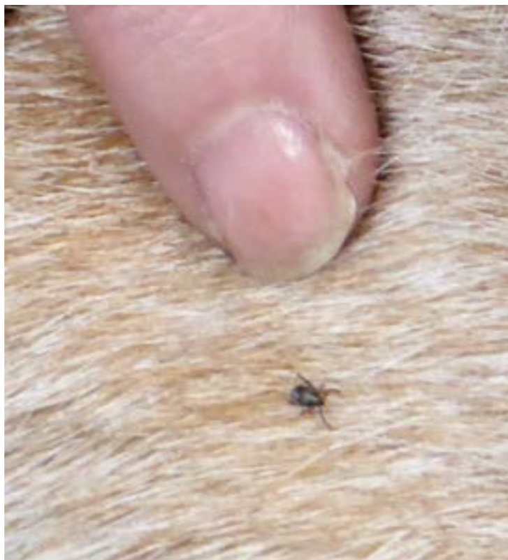
Flått som kravler på Gunvald.

Ønsker du å behandle hunden med et middel mot flått, bør du konsultere en veterinær. Det finnes mange uregistrerte legemidler for dette som ikke er like godt testet for bivirkninger. Det vanligste er enten å bruke et hundehalsbånd eller dråper som beskytter mot flåttbitt. Hundehalsbåndet er innsett med et middel som trekker ned i huden og sprer seg over hele hunden. Det er effektivt i ca fem måneder, men bør tas av hvis hunden skal bade.