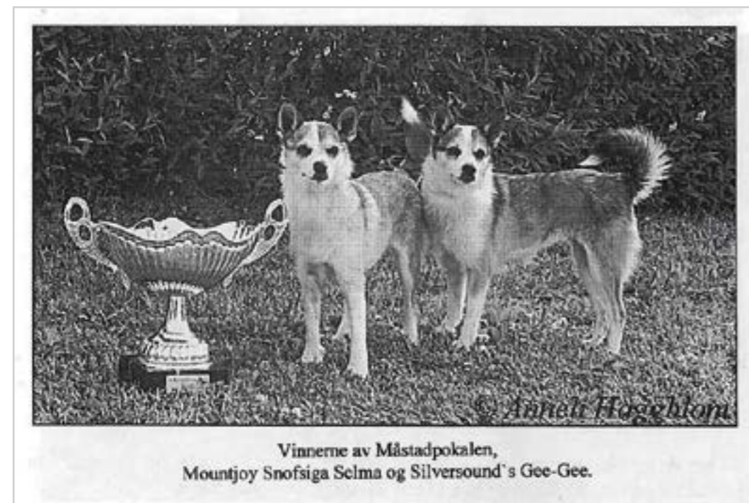
Vinnerne av Måstadpokalen, Mountjoy Snofsiga Selma og Silversound's Gee-Gee.