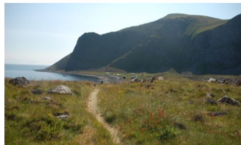
På vei til Måstad